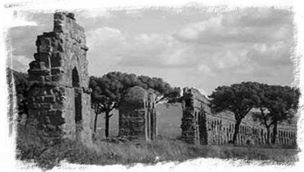
Scorcio della campagna romana